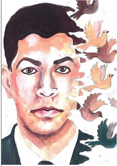
ÖMER HALİSDEMİR - 15 TEMMUZ ŞEHİDİ - ASKER